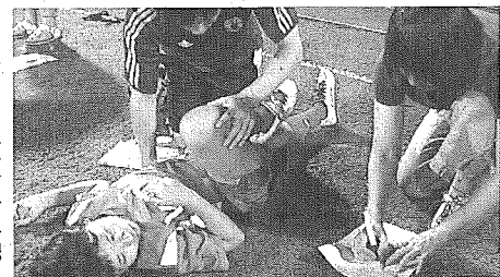
大分のサッカー教室はメディカルチェックなどの講習も実施

ガールズサッカースクール(☎0120・377・194)は大谷校が毎週水曜日に大谷小、香椎浜校が木曜日に香椎浜小で午後5～6時に開催。9日の午前10時～11時15分、香椎浜小で無料体験会もある。大分のスクール(☎080・1797・7045)はU-12が毎週月、木曜日、U-5が第2、第4木曜日に開催。U-12が午後7時半～9時、U-5は午後0時半～1時半。